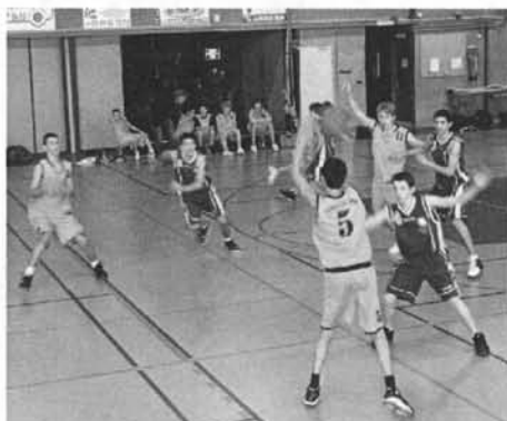
Du beau jeu à voir tous les week-ends !