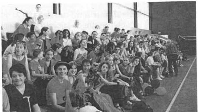
Le public, aux couleurs du club, dans le « Cugnaux Dôme »