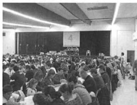
Carton plein pour les lotos du club !