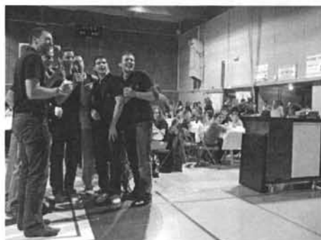
Soirée du club 2009 : Karaoké !